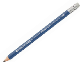
Crayon à mine HB de type Saedler