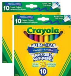
2 boîtes de 10 marqueurs lavables à pointe large couleurs classiques de type Crayola