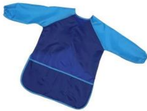
Tablier de peinture (ou vieux t-shirt du parent)