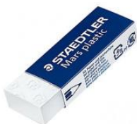
Gomme à effacer blanche de type Saedler