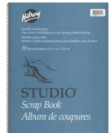
Album de coupures (scrapbook) à spirale 20 feuilles 35,5 cm X 27,9 cm de type Hilroy