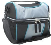
Boite à lunch