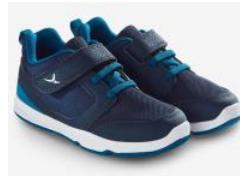
Souliers de course (qui resteront à l'école)