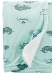
Petite couverture pour la détente