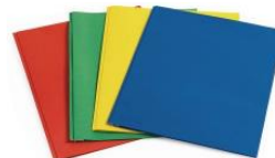
4 reliures à attaches sans pochette et en carton (duo-tang): 1 rouge , 1 verte , 1 jaune , 1 bleue de type Hilroy