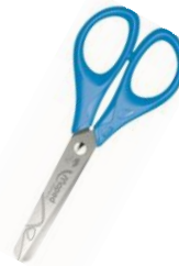
Ciseaux de 13 cm à bouts ronds