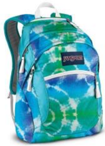
Sac d'école grand format

Identifier chaque article au nom de l'enfant