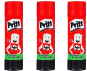
3 gros bâtons de colle (42 g) de type Pritt