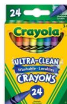
Boîte de 24 craies de cire lavables non twistables de type Crayola