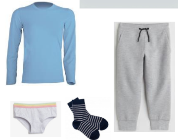
Vêtements de rechange dans un grand sac Ziploc