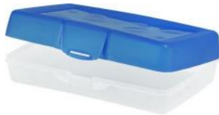
Boite de rangement pour crayons en plastique rigide de type Storex